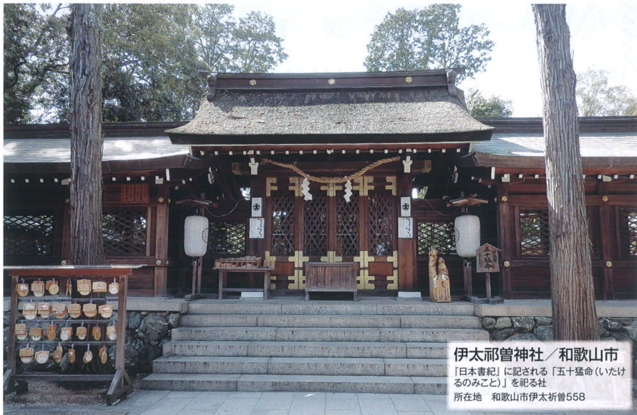
伊太祈曾神社 / 和歌山市