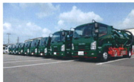
ズラリと並んだ車両

おじゃマンⅡ号 :社長の車も素敵ですけど?衛生車(20tバキューム)に始まり車両だけでも圧巻ですねー。