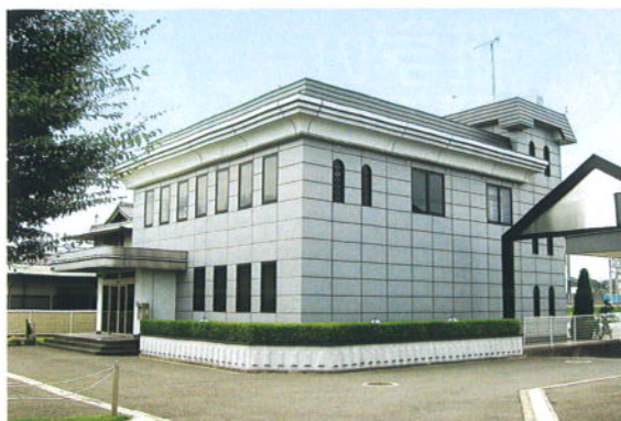
株式会社 青木実業