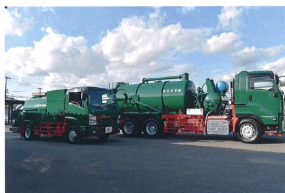
20t級強力吸引車など