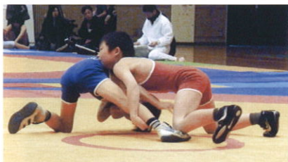
少年時代の辻さん

人気爆発シリーズめざして本年も猪突猛進いたします。『ポーっと原稿書いてんじゃねーよ!』ということできなり有害駆除・ジビエ料理対策で組合に採用(2018.5)された