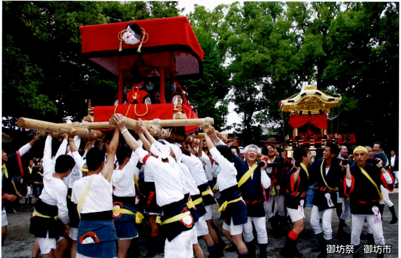
御坊祭 / 御坊市

URL http://w-kankoji.com/ E-mail: wakayama@w-kankoji.com