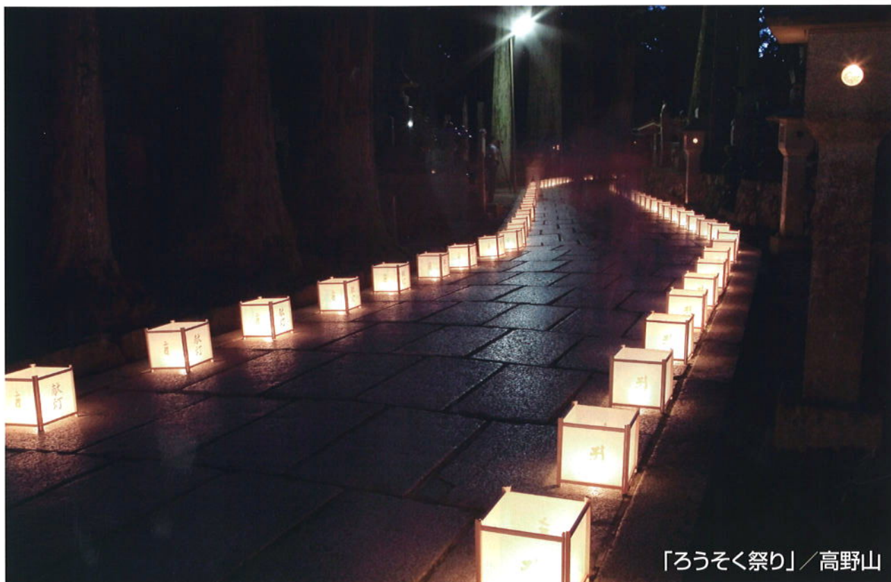
「ろうそく祭り」／高野山

URL http://w-kankoji.com/ E-mail: wakayama@w-kankoji.com