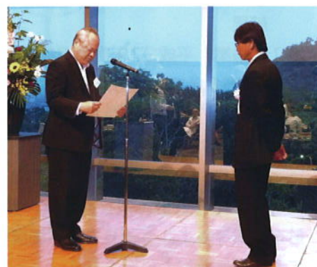
永年勤続者表彰式