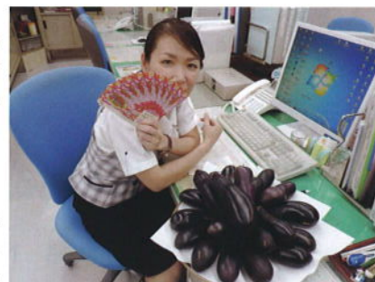
私は堅実に7,000万派です

ガッチリ当てます、『7,000万円』、ガッテン行きます『南米・リオデジャネイロ』、組合5人娘(元?)『チーム紀の水』でオリンピック行ってきまーす、お留守よろしく!Ponちゃん、局長一人になるんでお願いね!