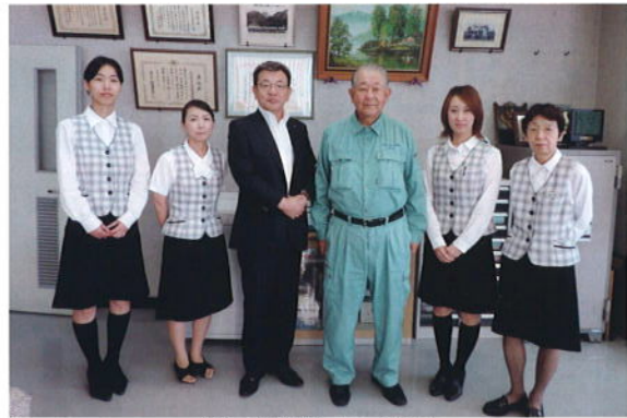
管工事組合にて取材

和歌山大学教育学部附属小学校→ 和歌山大学教育学部附属中学校→ 神戸育英高等学校卒業→ 追手門学院大学経済学部卒業 1980年4月 和歌山市役所に採用 1991年4月 和歌山市議会議員初当選