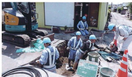
現地での活動状況