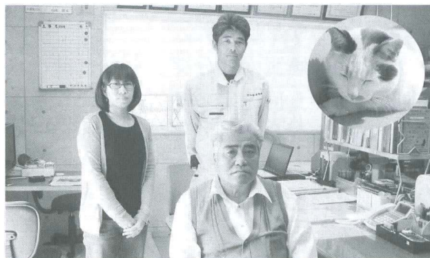
従業員と愛猫チビちゃん

おじゃマンII号:愛妻・愛猫のため『戦艦・山本』総裁、『デブレ』脱却、体重減量20%を目標に、来年頃には従業員の〇〇UPもよろしくお願いします。