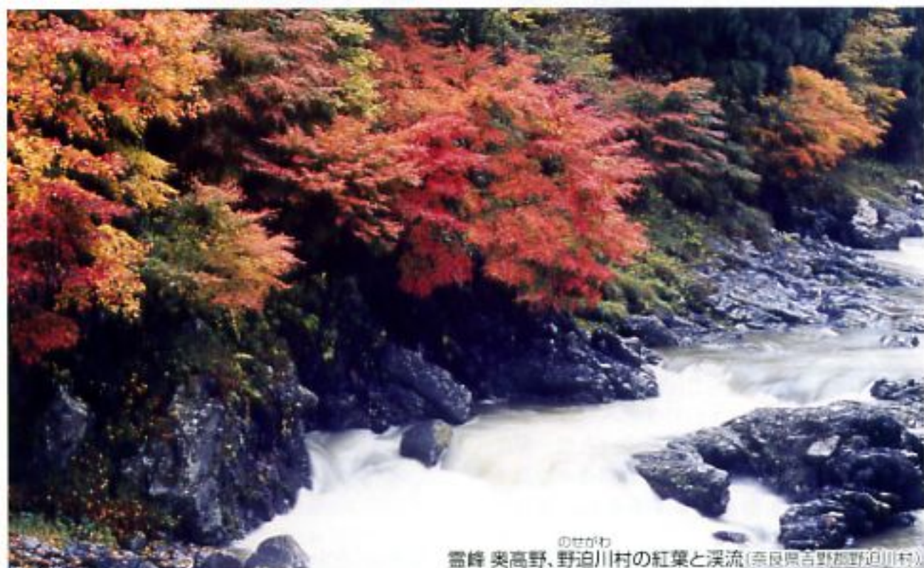
のせがわ 霊峰 奥高野、野迫川村の紅葉と溪流(奈良県高野郡野迫川村)