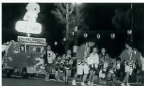
今年も山車を元気に引っ張る子ども達!

され、ちょっぴり大きくなったちびっ子たちは、山車の綱引きを卒業して、大人の後ろで楽しく踊っていました。