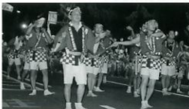
紀州おどりに参加する組合連

和歌山市最大の夏祭り紀州おどり“ぶんだら節”が8月1日に開催され、私たち組合連は今年も出場し、参加68連のぶんだら踊りが、真夏の夜に繰り広げられました。