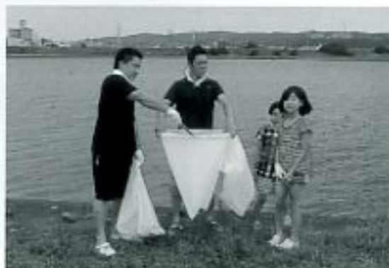
お父さん達もがんばってます!

当日は、午前8時に指定された清掃場所に集合し、8時30分より清掃活動を開始しました。清掃区域は例年同様、南海電鉄鉄橋～河西橋の間で、和歌山市水道局の皆さんと一緒に同じ区域を担当しました。河川のゴミは年々少なくなっているように感じますが、参加者をはじめ子